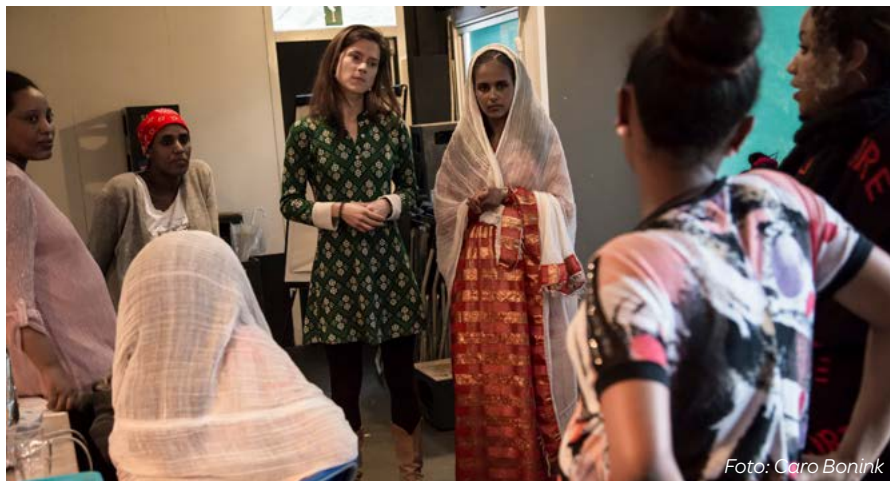
Voorheen werden de groepen aangeboden aan Eritrese vrouwen uit Amsterdam. Door corona schakelden we met succes over naar online.

Kijk op www.zoschakeltueentolkin.nl/tolk-voor-geboortezorg