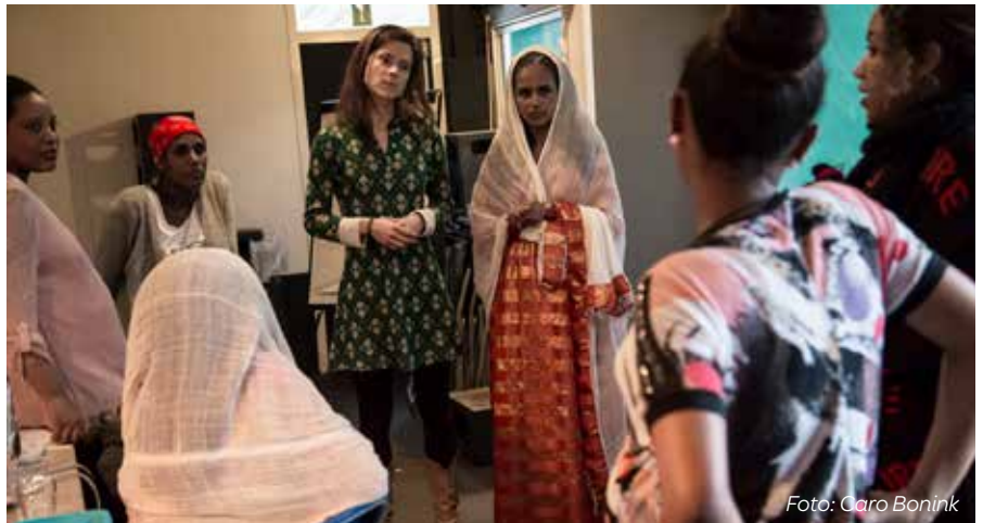
Voorheen werden de groepen aangeboden aan Eritrese vrouwen uit Amsterdam. Door corona schakelden we met succes over naar online.

Kijk op www.zoschakeltueentolkin.nl/tolk-voor-geboortezorg